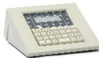
Teacher Control Unit