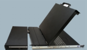
Detached Switch 232