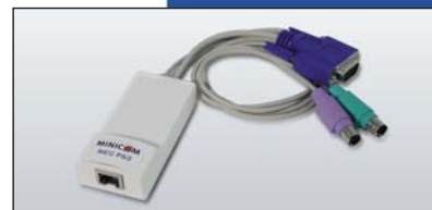
Câble RIC PS/2 (Existe également en USB et en SUN)