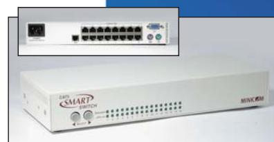
Smart CAT5 Switch, 16 Ports