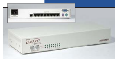
Smart CAT5 Switch, 8 Ports