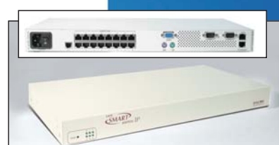
Smart 16 IP Switch